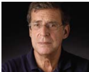
Vasco Graça Moura no ciclo Quintas de Leitura

22 nd MAR | PORTO THE FURIOUS PASSION FOR THE TANGIBLE - Vasco Graça Moura -Thursdays of Reading / Campo Alegre Theatre - 10pm