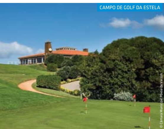
CAMPO DE GOLF DA ESTELA