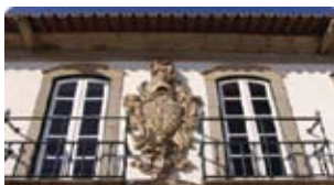
Audatório Municipal de Vila do Conde - brasão da fachada

1 º MAR TO 28 º APR | VILA DO CONDE MUNICIPAL AUDITORIUM - 20 YEARS / Vila do Conde Municipal Auditorium