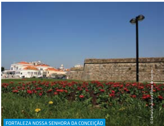
FORTALEZA NOSSA SENHORA DA CONCEIÇÃO