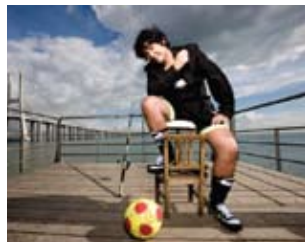
Alvim no ciclo Quintas de Leitura

19 th APR | PORTO A NIGHT TO FORGET - The Poetic Choices of Fernando Alvim - Thursdays of Reading / Campo Alegre Theatre - 10pm